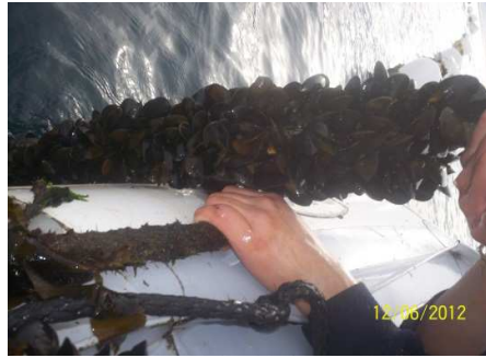
Longline de cultivo de mejillón

También posee una planta procesamiento de productos marinos, para dicha planta se están tramitando las habilitaciones pertinentes tanto municipales como nacionales. Dicha planta posee 140 metros cubiertos, cámara de frío, túnel de frío, y se está avanzando en la parte de elaboración de productos envasados.