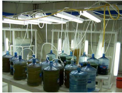
Sala de producción de algas